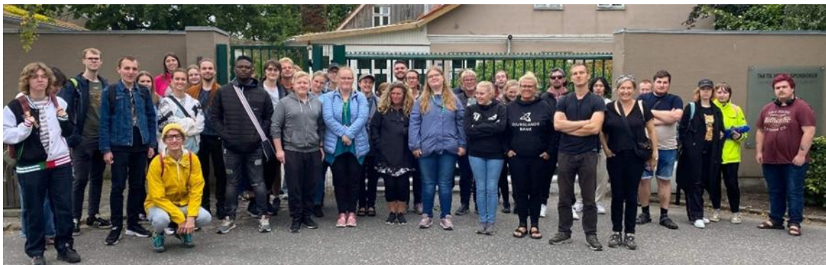
Fællestur til Ree Park sponsoreret af Djursland Bank

Tilbuddet er finansieret i 2023 med en bevilling fra Trygfonden, §18 puljen og små bevillinger fra lokale loger.